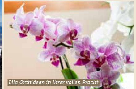
Lila Orchideen in ihrer vollen Pracht