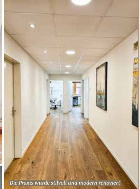
Die Praxis wurde stilvoll und modern renoviert