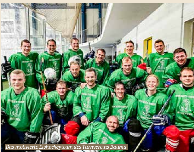
Das motivierte Eishockeyteam des Turnvereins Bauma

Eine motivierte Mannschaft des Turnvereins Bauma nahm am Sonntag, 14. April 2024 am alljährlichen Eishockey-Plauschturnier in Bäretswil teil. Bei diesem Turnier treten verschiedene Turnvereine aus der näheren Umgebung gegeneinander an.