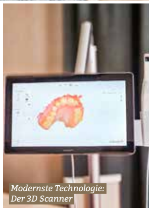
Modernste Technologie: Der 3D Scanner