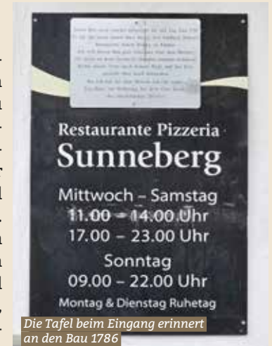
Die Tafel beim Eingang erinnert an den Bau 1786