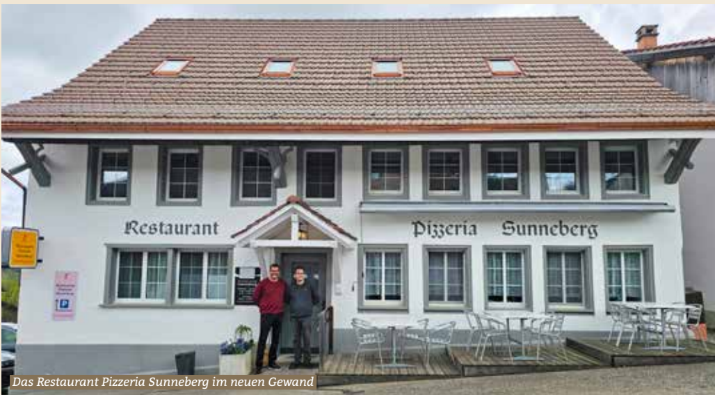
Das Restaurant Pizzeria Sunneberg im neuen Gewand

Das Restaurant Pizzeria Sunneberg in Dürstelen Hittnau erstrahlt nach einer umfangreichen Renovierung in neuem Glanz. Während die letzten Arbeiten auf der Rückseite noch im Gange sind, steht auch die Eröffnung der Gartenterrasse kurz bevor, wenn es das Wetter zulässt. Innerhalb des letzten halben Jahres wurde das Gebäude komplett umgebaut. Der Dachstock wurde erneuert und drei Wohnungen über dem Restaurant integriert, die ab nächsten Monat vermietet werden.