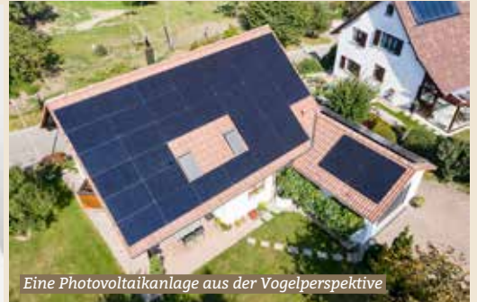
Eine Photovoltaikanlage aus der Vogelperspektive