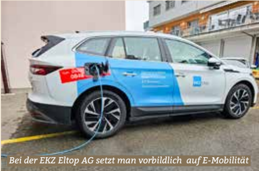
Bei der EKZ Eltop AG setzt man vorbildlich auf E-Mobilität

Weitere Impressionen aus der EKZ Eltop AG