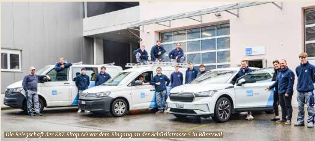
Die Belegschaft der EKZ Eltop AG vor dem Eingang an der Schürliststrasse 5 in Bäretswil