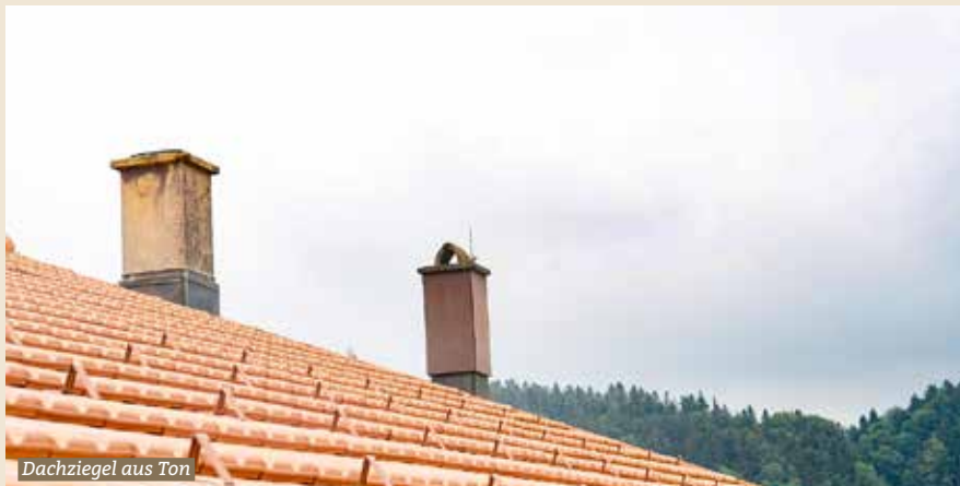
Dachziegel aus Ton