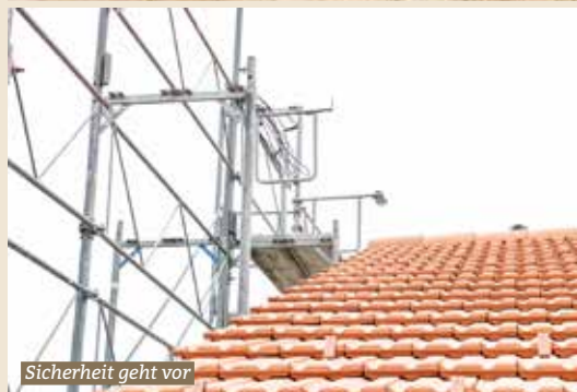
Sicherheit geht vor