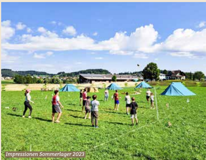
Impressionen Sommerlager 2023