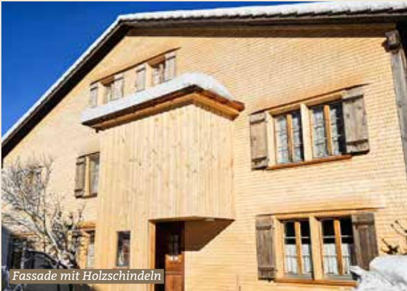
Fassade mit Holzschindeln