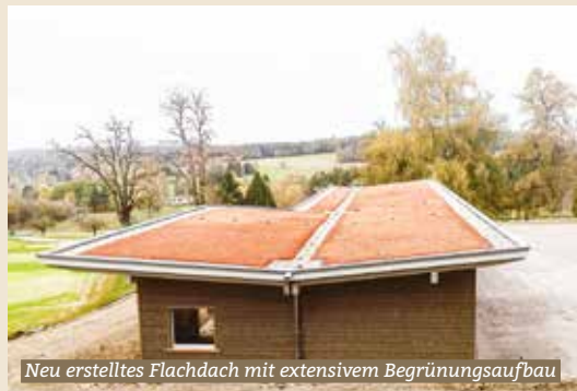
Neu erstelltes Flachdach mit extensivem Begrünungsaufbau