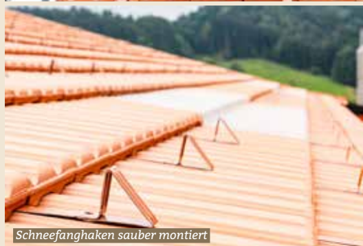
Schneefanghaken sauber montiert