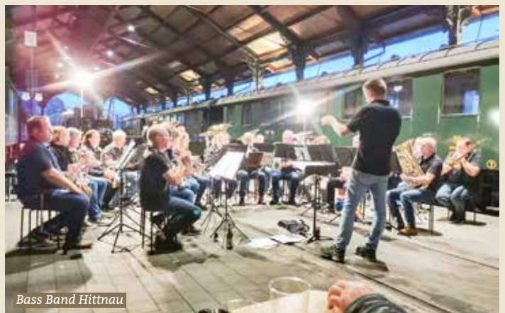
Brass Band Hittnau

Bereits zum 3. Mal in Folge fand das Konzert zum Ferienanfang am Freitag, 12. Juli statt. Die zahlreichen Besucher:innen füllten die Festbänke in der Bahnhofshalle innert kürzester Zeit. Mit Festwirtschaft vom Grill, Getränken und Kuchenbuffet war für das leibliche Wohl gesorgt.