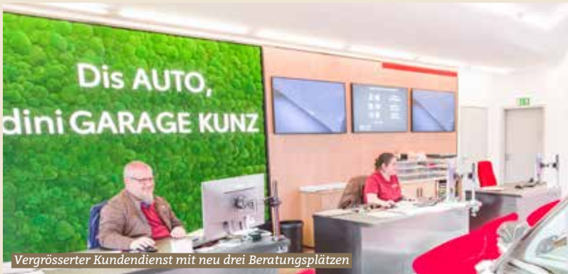
Vergrosserter Kundendienst mit neu drei Beratungsplätzen