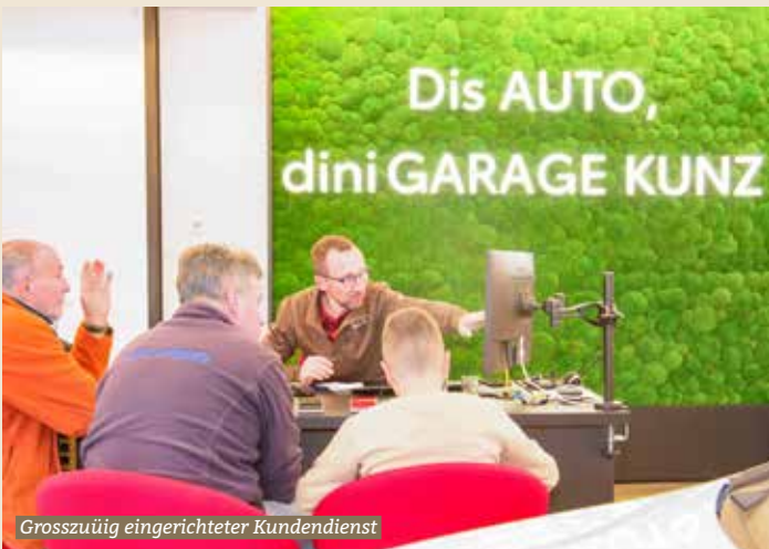
Grosszügig eingerichteter Kundendienst