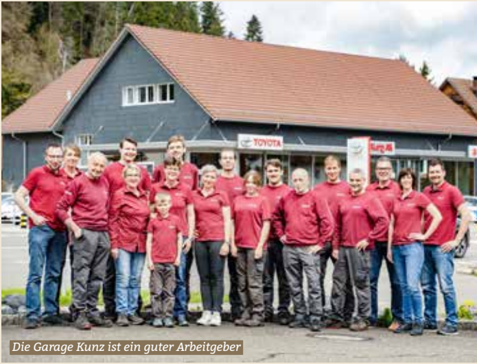
Die Garage Kunz ist ein guter Arbeitgeber