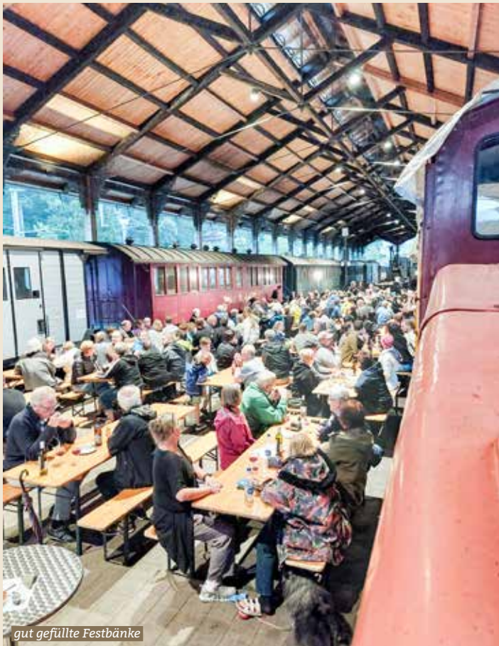
gut gefüllte Festbänke