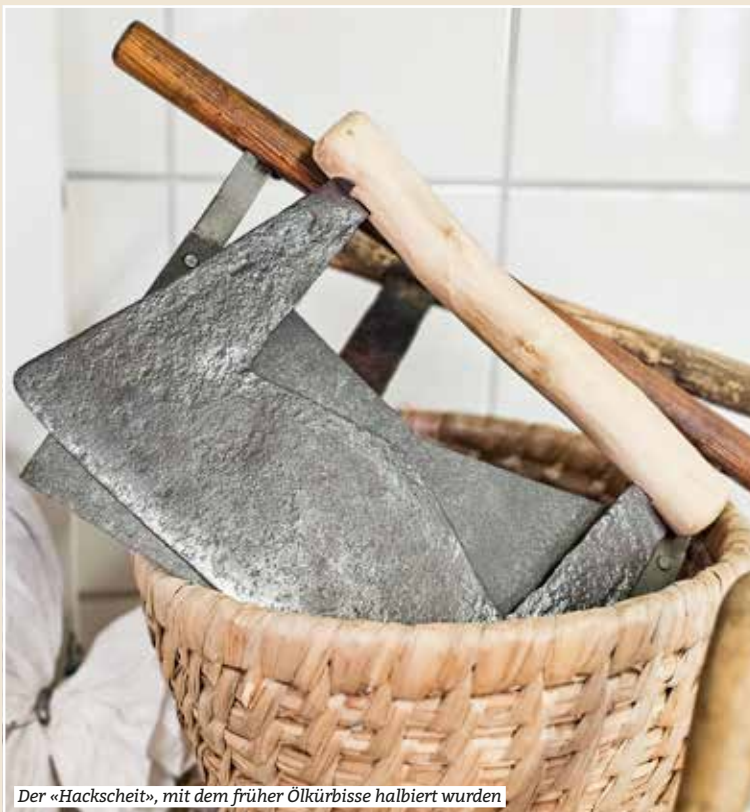
Der «Hackscheit», mit dem früher Ölkürbisse halbiert wurden