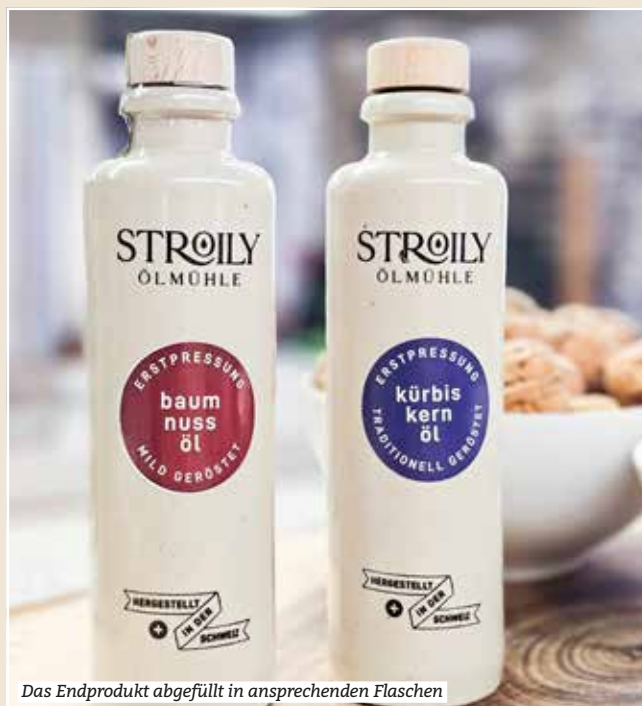
Das Endprodukt abgefüllt in ansprechenden Flaschen