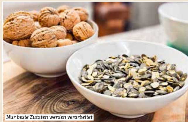
Nur beste Zutaten werden verarbeitet