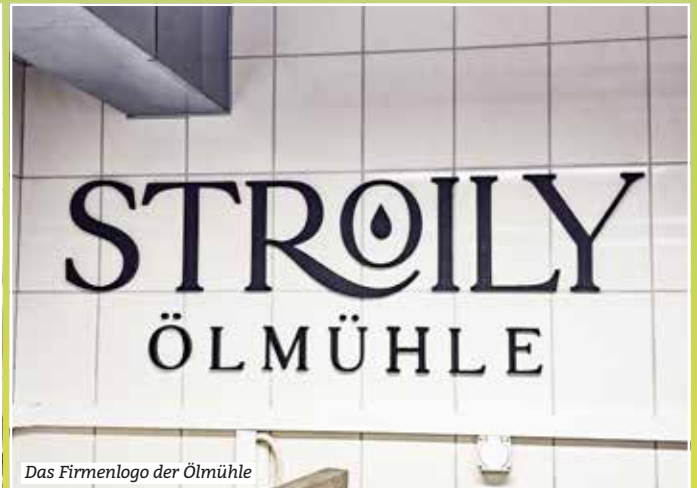
Das Firmenlogo der Ölmühle