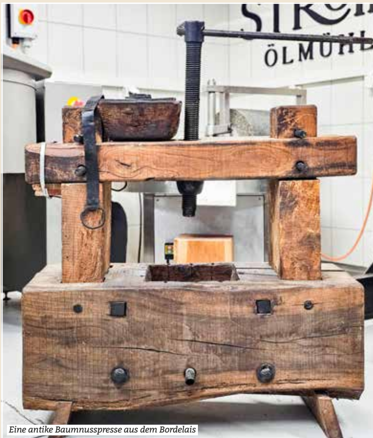
Eine antike Baumnusspresse aus dem Bordelais