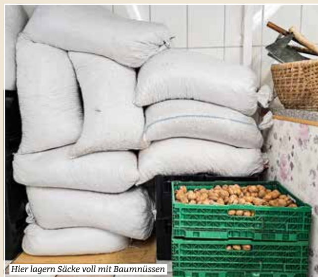
Hier lagern Säcke voll mit Baumnüssen