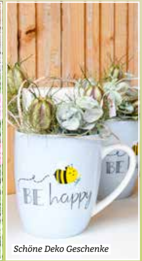
Schöne Deko Geschenke