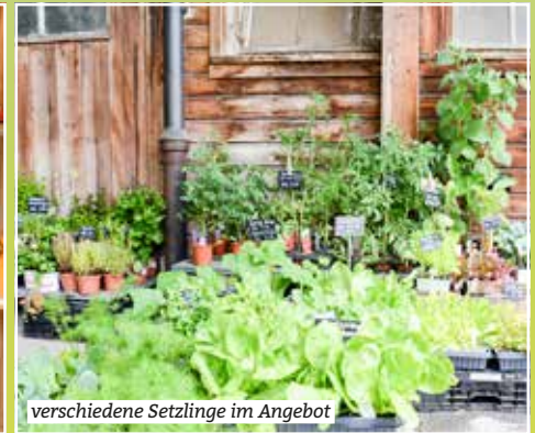
verschiedene Setzlinge im Angebot