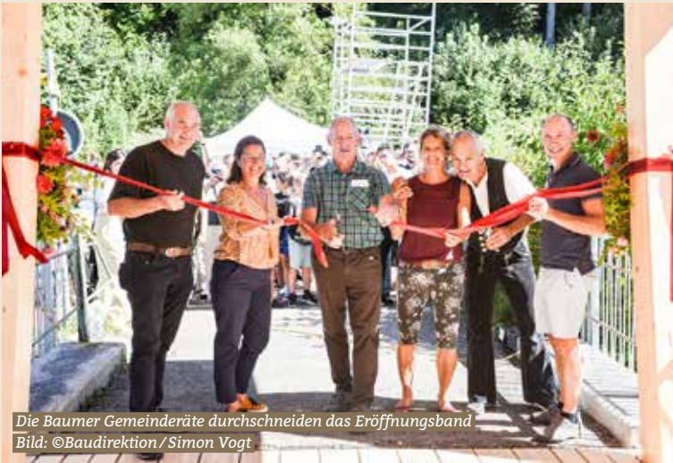
Die Baumer Gemeinderäte durchschneiden das Eröffnungsband