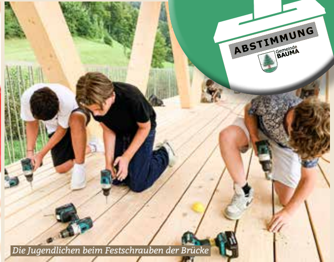
Die Jugendlichen beim Festschrauben der Brücke