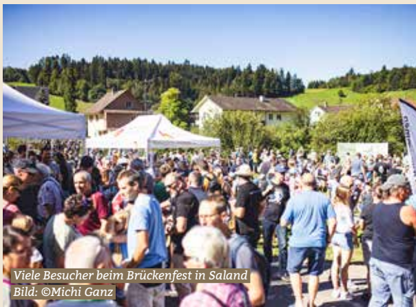
Viele Besucher beim Brückenfest in Saland