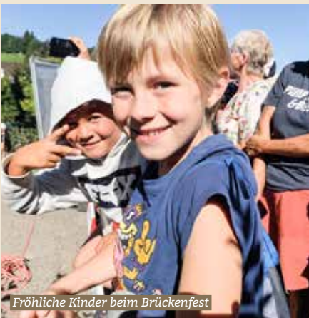
Fröhliche Kinder beim Brückenfest