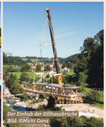
Der Einhub der Dillhausbrücke

Wer hätte gedacht, dass der Zweitklässler aus Bauma souverän mit dem Akkuschrauber Bodenplanken der Brücke festschrauben oder Eisenteile zusammenschweissen kann? Wer hätte gedacht, dass das gemeinsame Bauen so viele Kindergesichter zum Strahlen bringt? Wer hätte gedacht, dass es möglich ist, Kinder in dieses Projekt zu involvieren? Ja, vielleicht zuschauen, aber auch mitmachen...? Ist das nicht zu aufwändig, zu riskant und zu kompliziert?