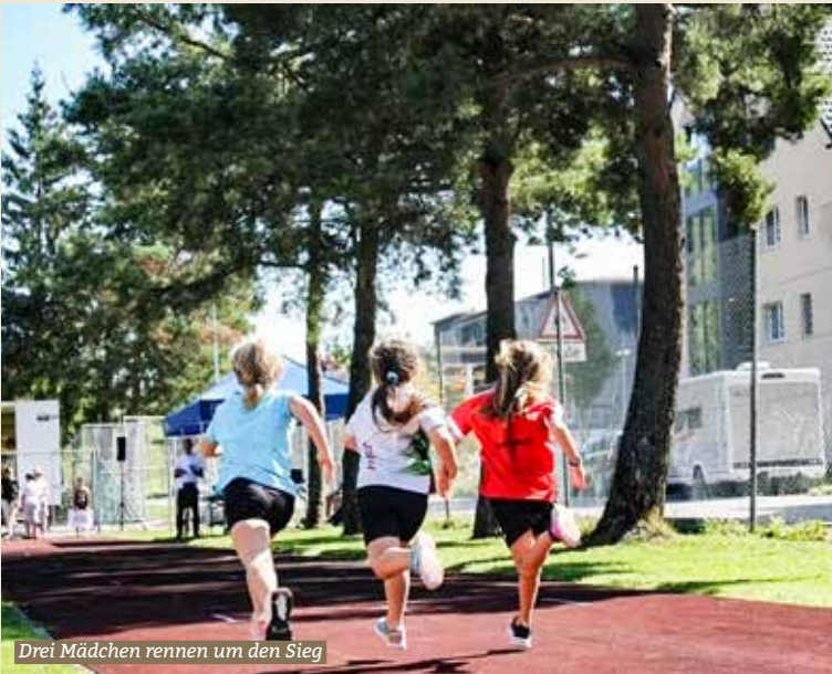
Drei Mädchen rennen um den Sieg