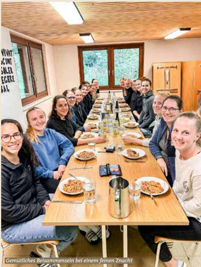
Gemütliches Beisammensein bei einem feinen Znacht

Am Samstagmorgen, dem 14. September, trafen wir uns mehr oder weniger pünktlich am Bahnhof Bauma. Nach einer etwa dreistündigen Fahrt kamen wir in Emmen im schönen Kanton Luzern an. Dort begaben wir uns zu einer Lasertaghalle und spielten in drei Gruppen gegeneinander. Etwas «ausgepowert» aber immer noch hochmotiviert düstern wir los zur nächsten Station: Stadt Luzern.