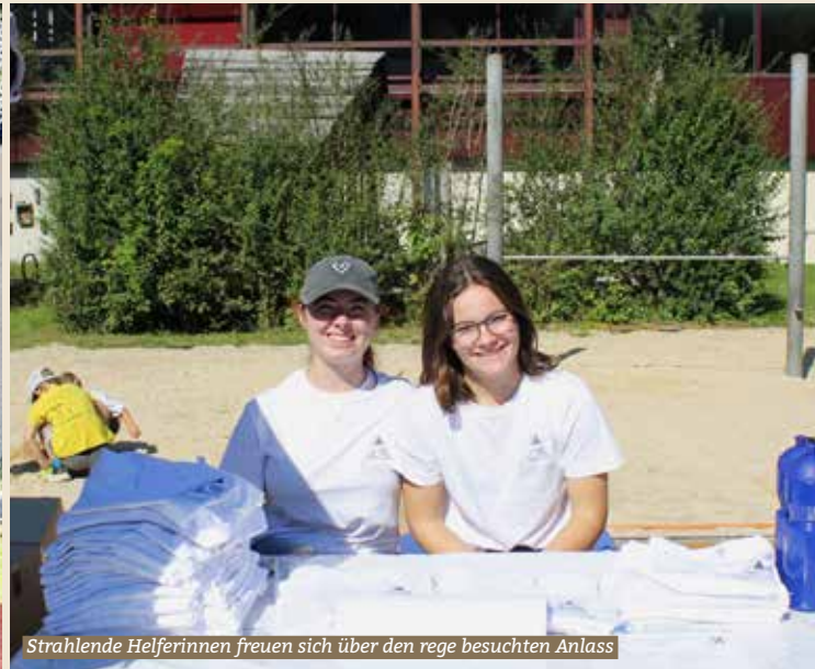
Strahlende Helferinnen freuen sich über den rege besuchten Anlass