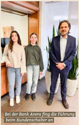
Bei der Bank Avera fing die Führung beim Kundenschalter an