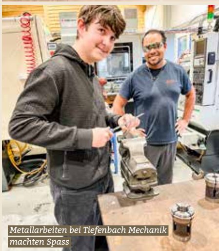
Metallarbeiten bei Tiefenbach Mechanik machten Spass