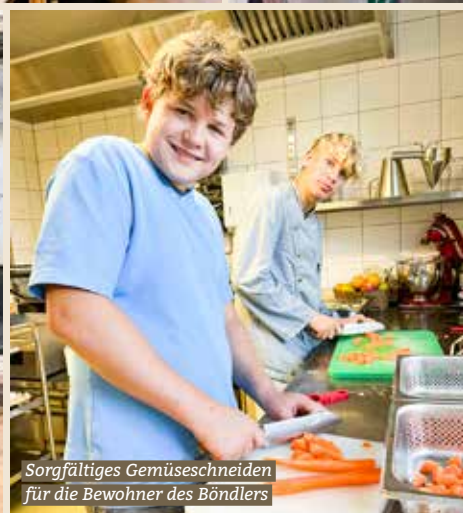
Sorgfältiges Gemüseschneiden für die Bewohner des Bändlers