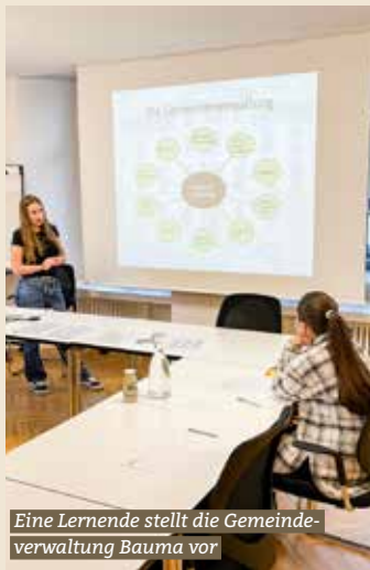
Eine Lernende stellt die Gemeindeverwaltung Bauma vor