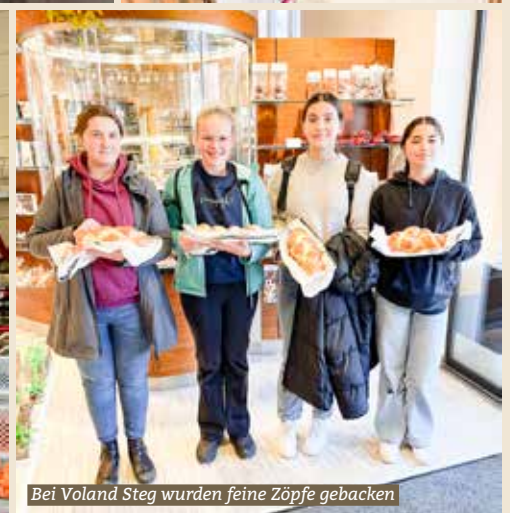
Bei Voland Steg wurden feine Zöpfe gebacken

Am Freitag, dem 25. Oktober, erhielten 41 Schülerinnen und Schüler der Sekundarschule Bauma eine besondere Gelegenheit, die Berufswelt aus erster Hand kennenzulernen. Im Rahmen des traditionellen Baumer Gewerbe-OLs besuchten die Jugendlichen jeweils zwei Betriebe in der Region und erhielten Einblicke in unterschiedliche Branchen. Für viele war dies die erste Betriebsbesichtigung und damit ein aufregender Schritt in die berufliche Zukunft. Der Baumer Gewerbe-OL stellt für die Zweitsekundarschülerinnen und Schüler eine wichtige Orientierungshilfe dar. Er ermöglicht es ihnen, Berufe und Arbeitsabläufe direkt im Betrieb zu erleben und erste Kontakte zu knüpfen. Diese Praxiseindrücke sind ein bedeutender Baustein im Berufswahlprozess und tragen dazu bei, die Interessen der Jugendlichen zu stärken. Der Anlass ist jedoch nicht nur für die Schülerinnen und Schüler von grossem Nutzen: Auch die Gewerbebetriebe profitieren, indem sie potenzielle zukünftige Lehrlinge kennenlernen und sich als attraktive Ausbildungsbetriebe präsentieren können. Dieses Jahr war besonders: Mit rekordverdächtigen 23 teilnehmenden Betrieben konnte eine Vielfalt geboten werden, die es so bisher noch nie gab. Von kleinen Handwerksbetrieben bis hin zu mittelgrossen Unternehmen öffneten zahlreiche Betriebe ihre Türen und ermöglichten den Jugendlichen vielfältige Einblicke.