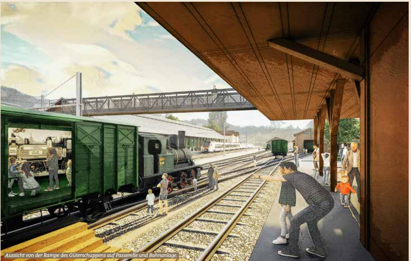
Aussicht von der Rampe des Güterschuppens auf Passerelle und Bahnanlage.

Der Dampfbahn-Verein Zürcher Oberland plant zusammen mit dem Amt für Abfall, Wasser, Energie und Luft (AWEL) des Kantons Zürich und SBB Immobilien die Weiterentwicklung des Depotareals am Bahnhof Bauma. Per Ende 2024 konnten die Projektverantwortlichen das Bewilligungsdossier erarbeiten und einreichen. Am Montag, 20. Januar 2025 um 19.15 Uhr laden die Projektpartner die Einwohnerinnen und Einwohner der Gemeinde Bauma zu einem Infoanlass in den Saal des Gasthauses Tanne ein. In der gleichen Woche beginnen die Aussteckungsarbeiten.