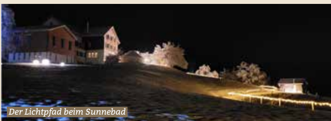
Der Lichtpfad beim Sunnebad

Vom 29. November 2024 bis am 5. Januar 2025 war rund ums Sunnebad ein Lichtpfad installiert. Den beleuchteten Weg mit der Weihnachtsgeschichte, Waldtieren und verschiedenen Lichtinstallationen der Firma Lumentec.ch, besuchten viele Gäste und Familien in der Adventszeit.