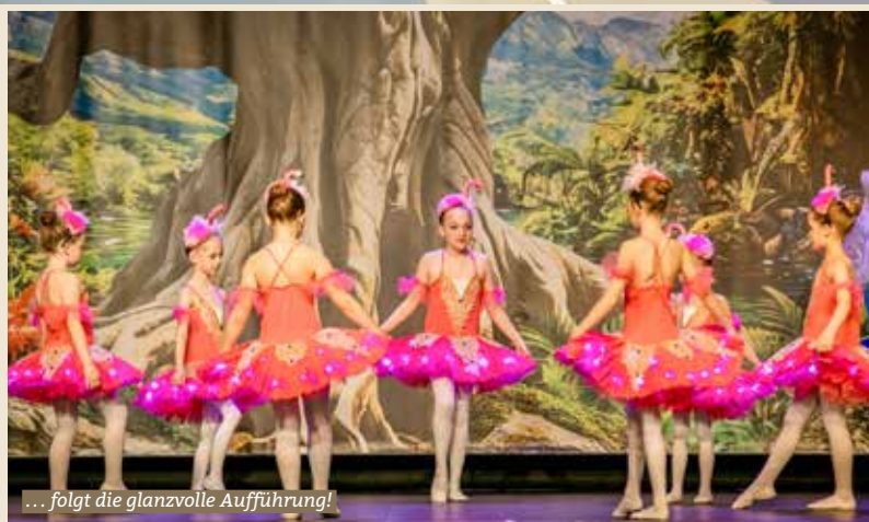
... folgt die glanzvolle Aufführung!