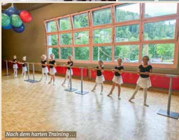
Nach dem harten Training ...