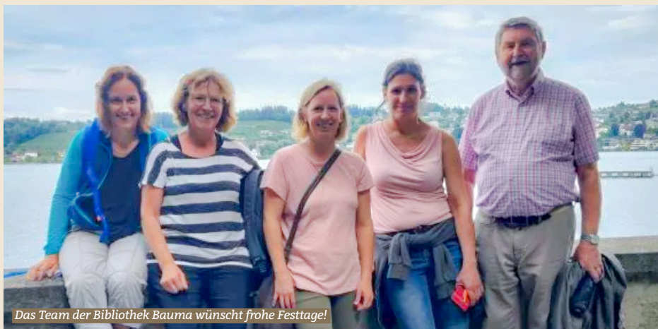
Das Team der Bibliothek Bauma wünscht frohe Festtage!