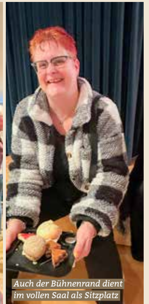
Auch der Bühnenrand dient im vollen Saal als Sitzplatz