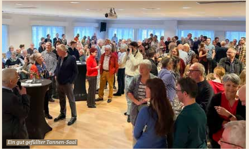
Ein gut gefüllter Tannen-Saal