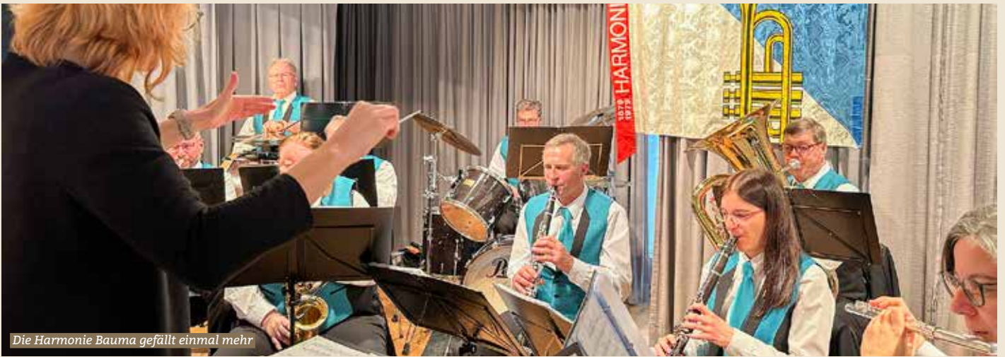
Die Harmonie Bauma gefällt einmal mehr