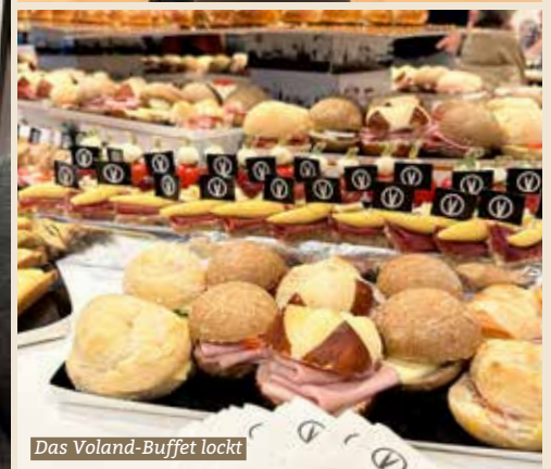
Das Voland-Bufferf lockt

Der diesjährige Neujahrspéro beginnt mit einer Schweigeminute für alle Opfer der Walliser Club-Tragödie. Der Gemeindepräsident Andreas Sudler zeigt grosse Anteilnahme, ist aber auch sichtlich erleichtert, dass ein solches Unglück nicht auch in Bauma passiert ist.