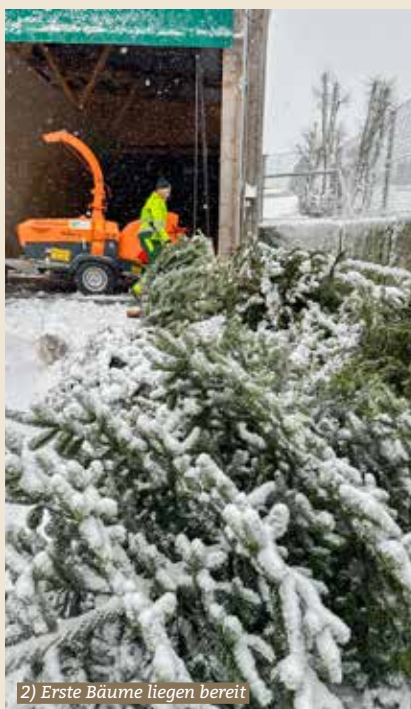
2) Erste Bäume liegen bereit