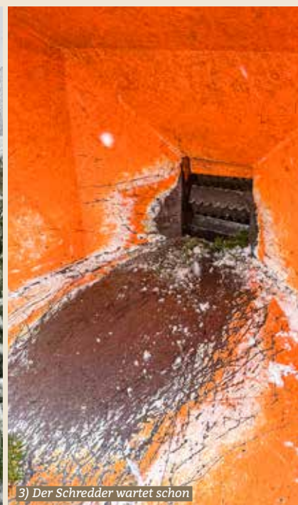
3) Der Schredder wartet schon

Am vergangenen Samstag bot der Wärmeverbund Bauma einmal mehr die Möglichkeit, ausgediente Christbäume kostenlos und sinnvoll zu entsorgen. Wegen des plötzlichen Schneewinters nutzten dieses Jahr nur wenige Einheimische das Angebot und brachten ihre Weihnachtsbäume in die Heizzentrale vorbei – mit dem guten Gefühl, dass diese nicht einfach als Abfall enden, sondern nochmals einen wertvollen Zweck erfüllen.