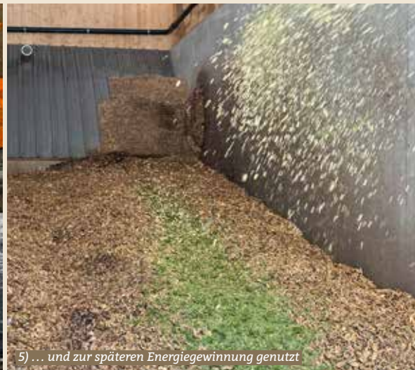
5) ... und zur späteren Energiegewinnung genutzt