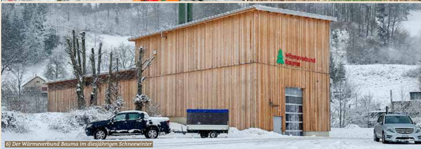
6) Der Wärmeverbund Bauma im diesjährigen Schneewinter