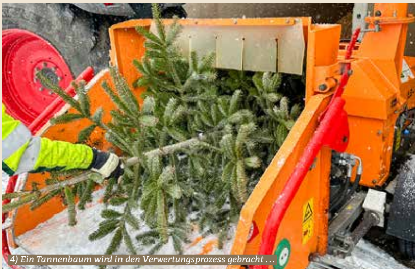
4) Ein Tannenbaum wird in den Verwertungsprozess gebracht...