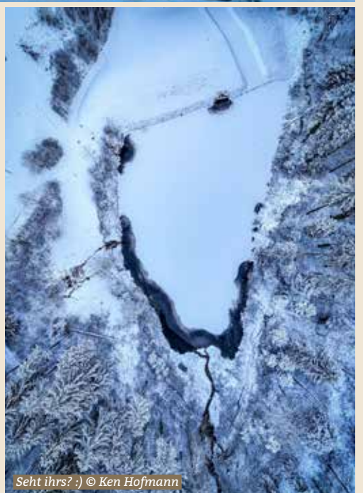
Seht ihrs? :)