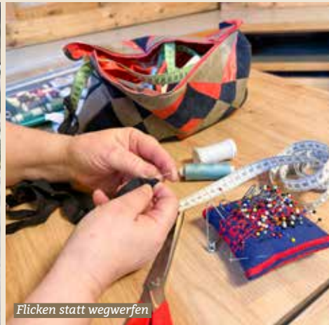
Flicken statt wegwerfen