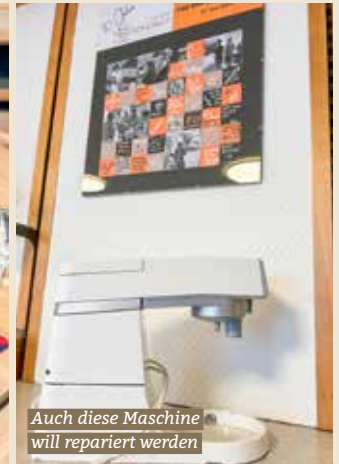
Auch diese Maschine will repariert werden

Anschliessend flickt der Profi das gute Stück zu Hause, und einen Monat später kann das «fast» neue Lieblingsstück wieder abgeholt werden. Es wird repariert, was repariert werden kann, dazu gibt es in gemütlicher Atmosphäre Kaffee, Tee und selbstgebackenen Kuchen.