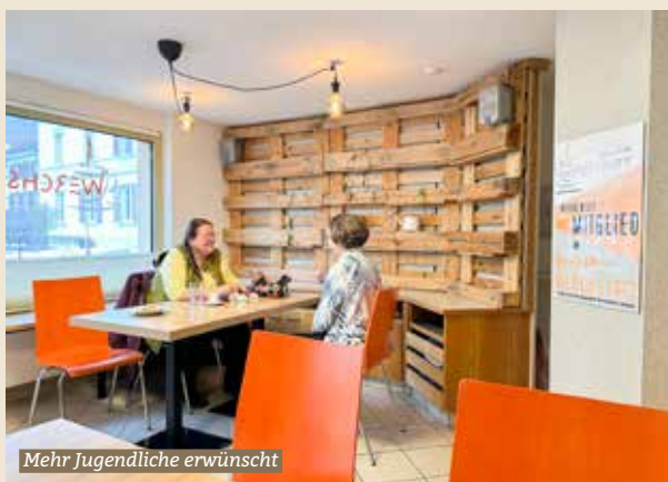
Mehr Jugendliche erwünscht