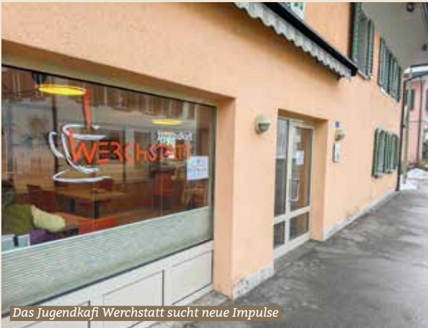
Das Jugendkafi Werchstatt sucht neue Impulse