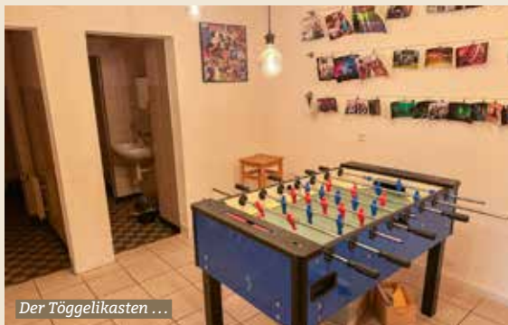
Der Töggelikasten ...