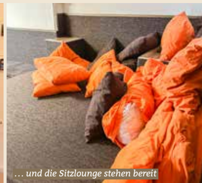
... und die Sitzlounge stehen bereit

Mit Offenheit für neue Formate und dem Wunsch nach mehr Beteiligung sucht die Leitung um Regina Honegger den Austausch mit einer Generation, welche das Kaffee nicht nur nutzen, sondern aktiv mitgestalten soll: «Die Werchstatt ist seit Jahren ein Ort der Begegnung, des Austauschs und des gemeinsamen Tuns», sagt Honegger.