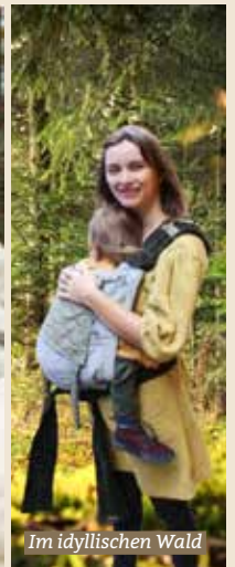
Im idyllischen Wald