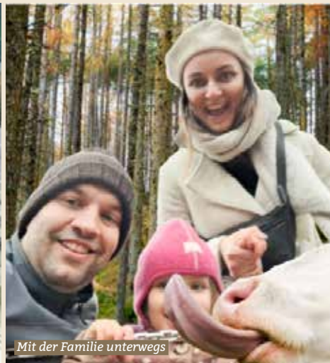
Mit der Familie unterwegs