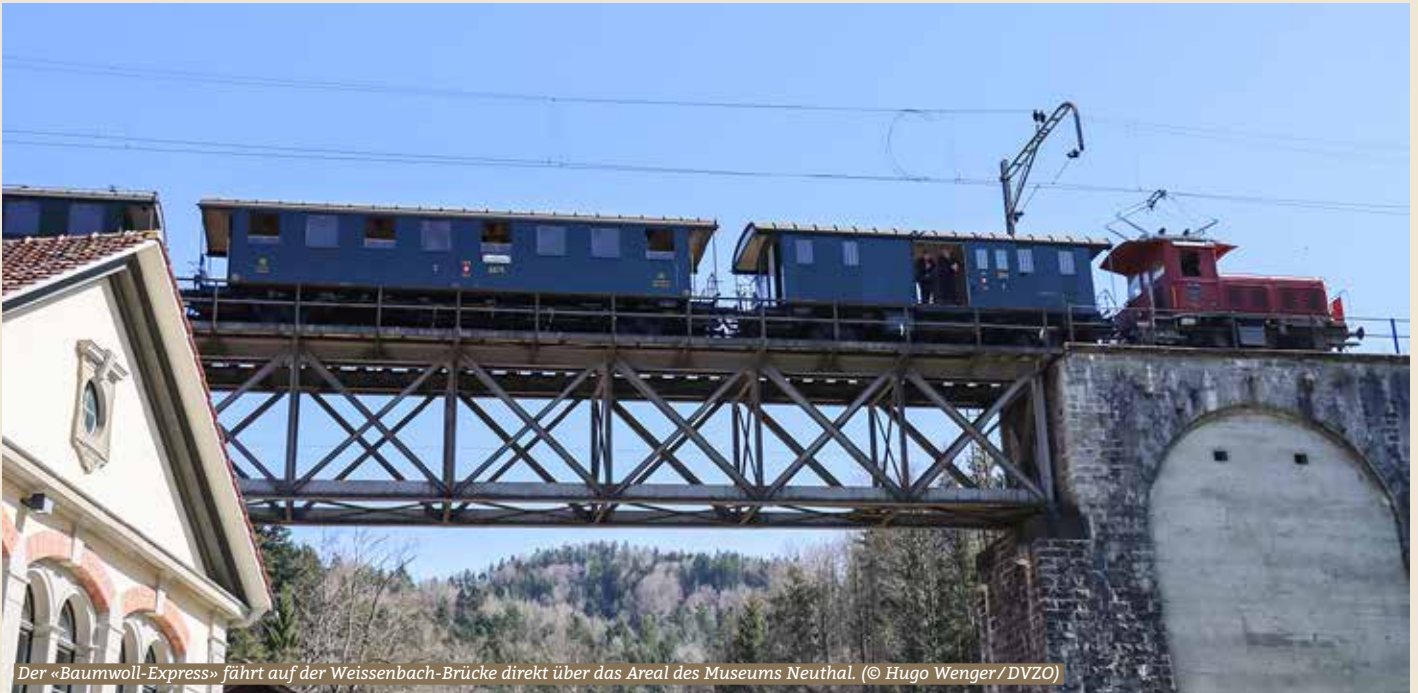
Der «Baumwoll-Express» fährt auf der Weissenbach-Brücke direkt über das Areal des Museums Neuthal.

Der Dampfbahn-Verein Zürcher Oberland DVZO baut sein Angebot aus: Erstmals gibt es von Mai bis Oktober jeden Sonntag ein Angebot. An ausgewählten Sonntagen fährt der neue «Baumwoll-Express» mit Museumsbesuch in Neuthal. Ein Meilenstein für Ausflügler und Familien.