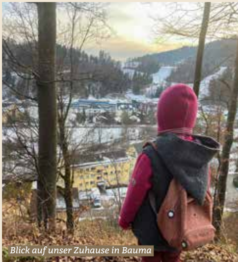
Blick auf unser Zuhause in Bauma