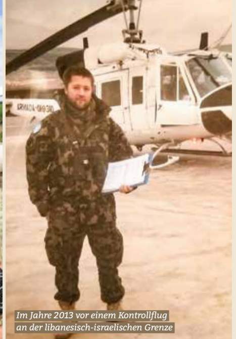
Im Jahre 2013 vor einem Kontrollflug an der libanesisch-israelischen Grenze