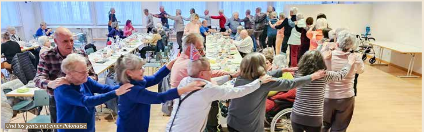
Und los gehts mit einer Polonaise

Am Mittwoch, 11. Februar 2026 versammelten sich trotz trübem Wetter rund 60 Teilnehmende im Tannensaal. Die Tische waren mit bunten Fasnachtsschlangen geschmückt und verbreiteten eine fröhliche Atmosphäre. Besonders freuten wir uns über einige neue Gesichter, die den Weg in die Tanne gefunden hatten.