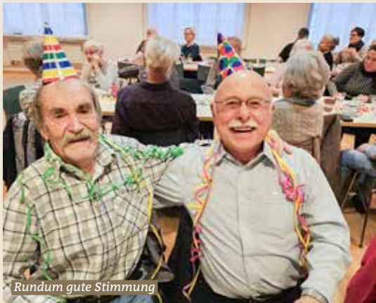
Rundum gute Stimmung