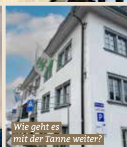
Wie geht es mit der Tanne weiter?