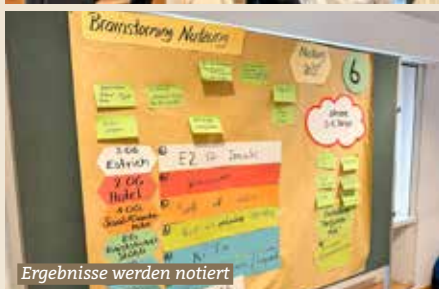
Ergebnisse werden notiert