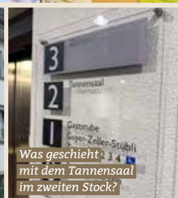
Was geschieht mit dem Tannensaal im zweiten Stock?

Mit regem Interesse und grosser Beteiligung fand kürzlich in Bauma der Workshop «Zukunft Tanne» statt. Ziel der Veranstaltung war es, gemeinsam mit der Bevölkerung Ideen und Bedürfnisse für die zukünftige Nutzung des traditionsreichen Gebäudes zu sammeln. In moderierten Arbeitsgruppen diskutierten die Teilnehmenden intensiv über mögliche Szenarien und entwickelten realistische Vorschläge für die Weiterentwicklung der Tanne als zentralen Begegnungsort im Dorf.