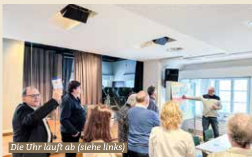
Die Uhr läuft ab (siehe links)