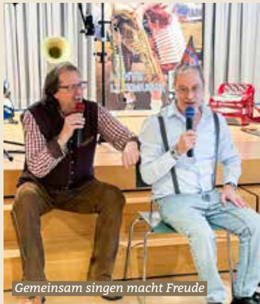
Gemeinsam singen macht Freude