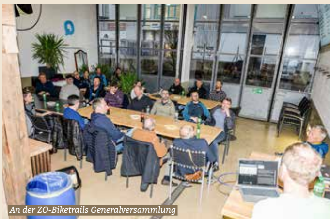
An der ZO-Biketrails Generalversammlung

Der Verein ZO-Biketrails hat sich etabliert. Dies wurde an der 4. Generalversammlung vom 30. März in Hinwil deutlich. Mit 9 Mitgliedsvereinen und rund 100 Mitgliedern vertritt der Verein gegen 1200 Mountainbikende im Zürcher Oberland.