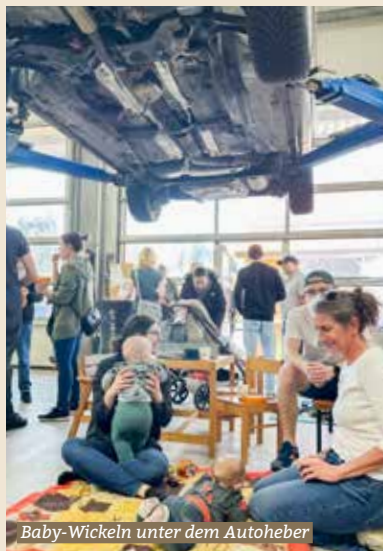
Baby-Wickeln unter dem Autoheber