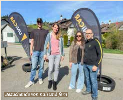
Besuchende von nah und fern