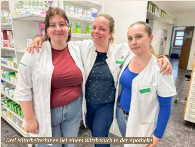
Drei Mitarbeiterinnen bei einem Blitzbesuch in der Apotheke