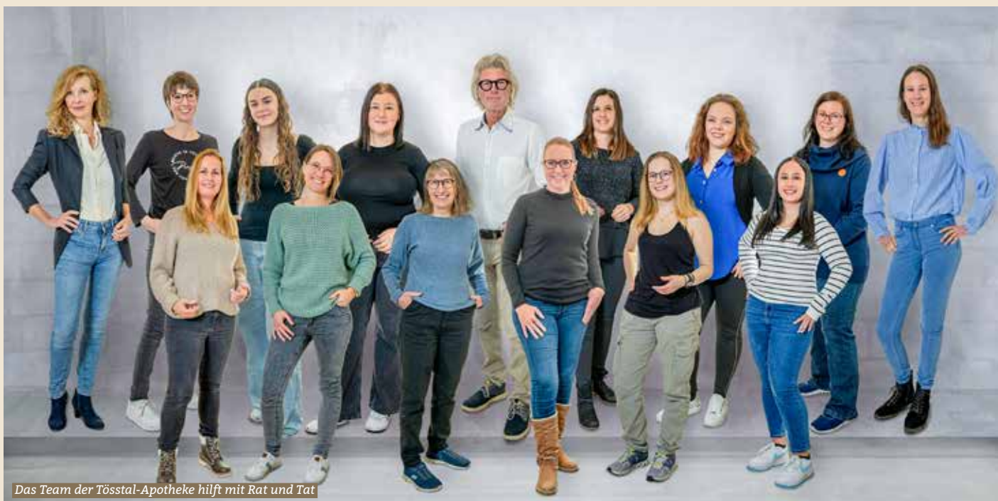
Das Team der Tösstal-Apotheke hilft mit Rat und Tat

Solche Aktionen bieten der Kundschaft eine niederschwellige Möglichkeit, Gesundheitsfragen frühzeitig abzuklären. So kann manch einer bei einem Verdacht den Gang zur Arztpraxis vermeiden. Viele schätzen die persönliche Beratung und kommen gezielt vorbei, aber es kommt auch vor, dass sich jemand spontan zu einer Messung entschliesst. Solche Angebote sind ein fester Bestandteil der Jahresplanung, und helfen uns, den Kontakt mit der Bevölkerung zu wahren.