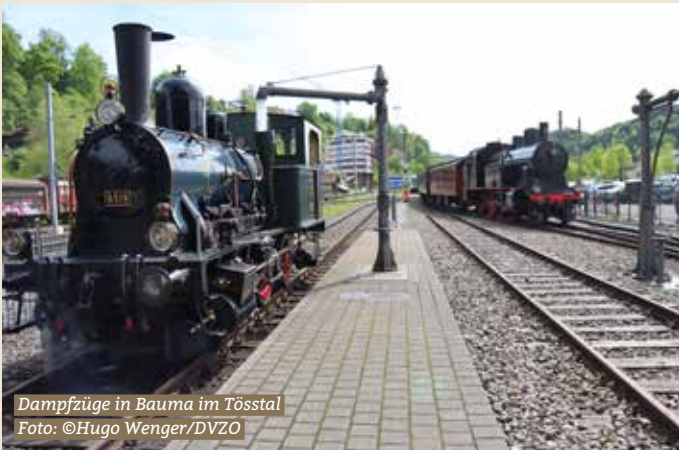
Dampfzüge in Bauma im Tössstal

Seit Sonntag, 3. Mai 2026, heisst es im Zürcher Oberland wieder: einsteigen, zurücklehnen und Geschichte erleben. Der Dampfbahn-Verein Zürcher Oberland (DVZO) lädt zur neuen Saison – mit einem klaren Versprechen: Erlebnisse auf Schienen, Woche für Woche – immer am Sonntag.