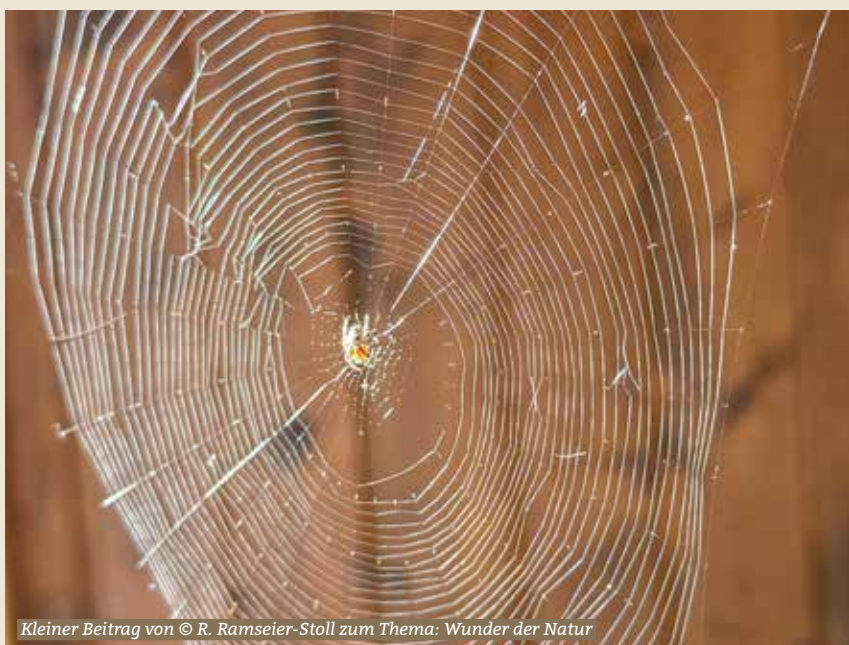
Kleiner Beitrag von © R. Ramseier-Stoll zum Thema: Wunder der Natur