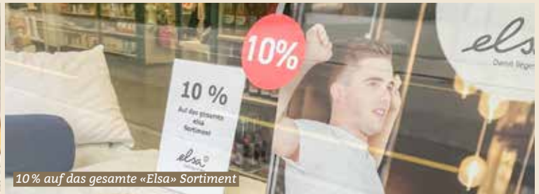
10% auf das gesamte «Elsa» Sortiment