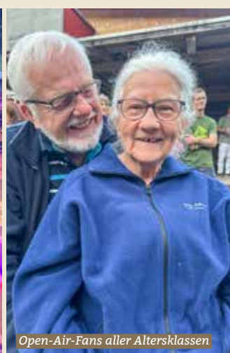
Open-Air-Fans aller Altersklassen