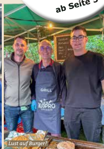
Lust auf Burger?