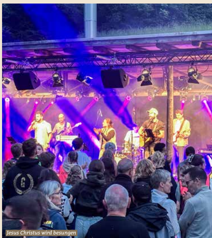
Jesus Christus wird besungen

Gemeinde BAUMA Beleuchtender Bericht zur kommenden Gemeindeversammlung vom 29. Juni 2026 ab Seite 5