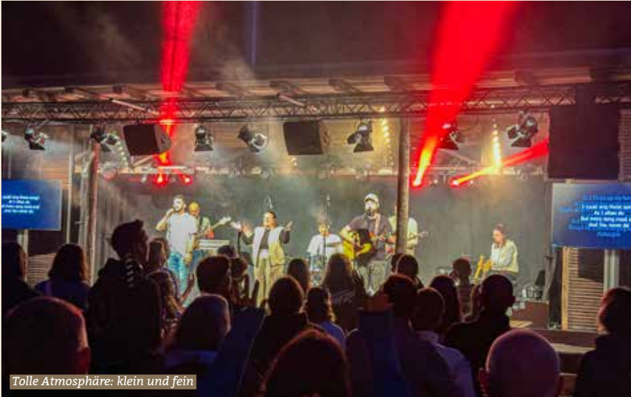
Tolle Atmosphäre: klein und fein