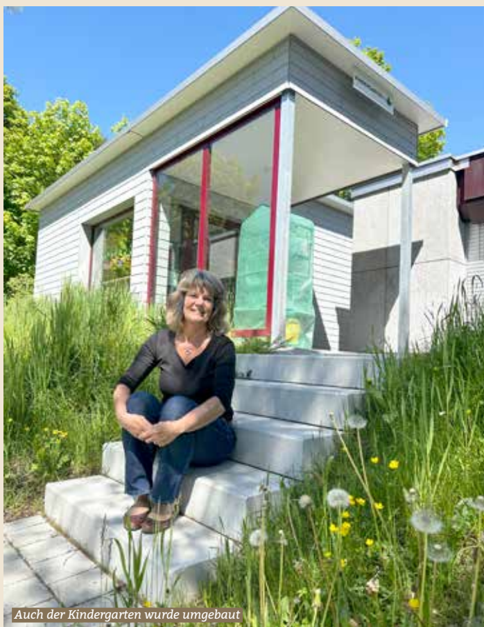
Auch der Kindergarten wurde umgebaut