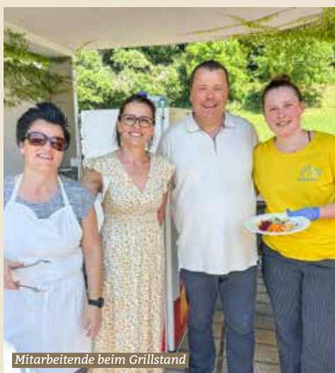
Mitarbeitende beim Grillstand