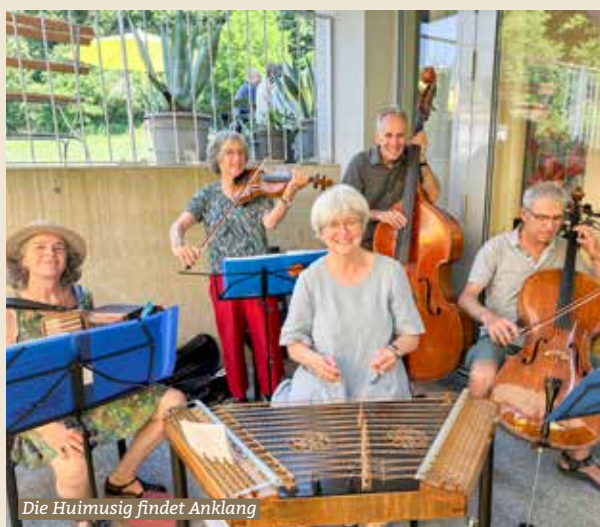
Die Huimusig findet Anklang