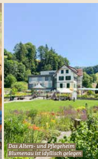
Das Alters- und Pflegeheim Blumenau ist idyllisch gelegen

«In diesem hinteren Teil von Bauma war ich noch nie», sagt eine Besucherin des Garten- und Grillfests in der Blumenau. Ein Satz, der an diesem Samstag, dem 27. Juni 2026, wohl stellvertretend für viele Gäste steht. Denn obwohl das Alters- und Pflegeheim Blumenau seit über 130 Jahren besteht, entdecken immer wieder zahlreiche Menschen den idyllisch gelegenen Ort am Blumenauweg 9, zum Beispiel beim Tag der offenen Tür – und zeigen sich beeindruckt von seiner besonderen Lage und Atmosphäre.